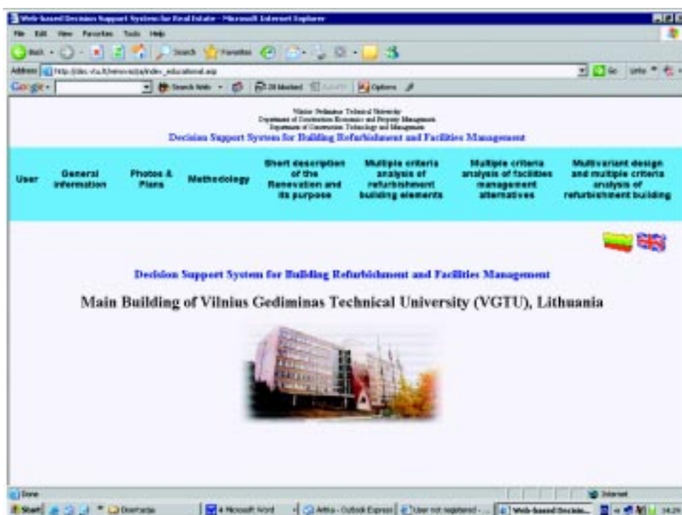
1 pav. Pastatų atnaujinimo žiniomis grįsta sprendimų paramos sistema

PR-SPS sudaryta iš duomenų bazės ir duomenų bazės valdymo sistemos, modelių bazės ir modelių bazės valdymo sistemos, vartotojo sąsajos (2 pav.).