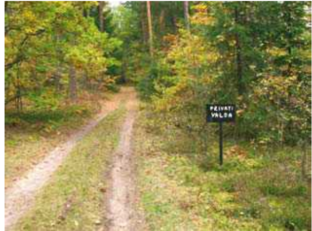
1 pav. Ženklas Privati valda vidury miško – dažnas ir klaidinantis reiškinys dabartinėje Lietuvoje Fig. 1. Misleading sign “Private” in the middle of a forest – common sight in Lithuania nowadays.

Remiantis Miškų įstatymu , kiekvienas žmogus Lietuvoje turi teisę laisvai lankytis miškuose , išskyrus rezervatų ir specialios paskirties objektų (pasienio zona, kariniai objektai ir kt.) miškus. Galima rinkti vaisius ir vaistažoles, grybauti ir uogauti. Lankytis miške gali uždrausti tik valdžios institucijos, kai yra labai rimtas pagrindas (didelis gaisringumas, vyksta kirtimai ir pan.), tačiau nei šiame įstatyme, nei kituose nieko nėra pasakyta apie galimybes stovyklauti.